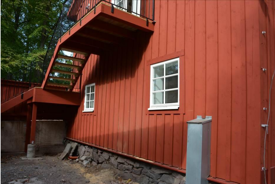
Skjulet är rivet, fönstren framlockade och utrymningstrappan byggd. BildID: Vlm_kmvSB-5336