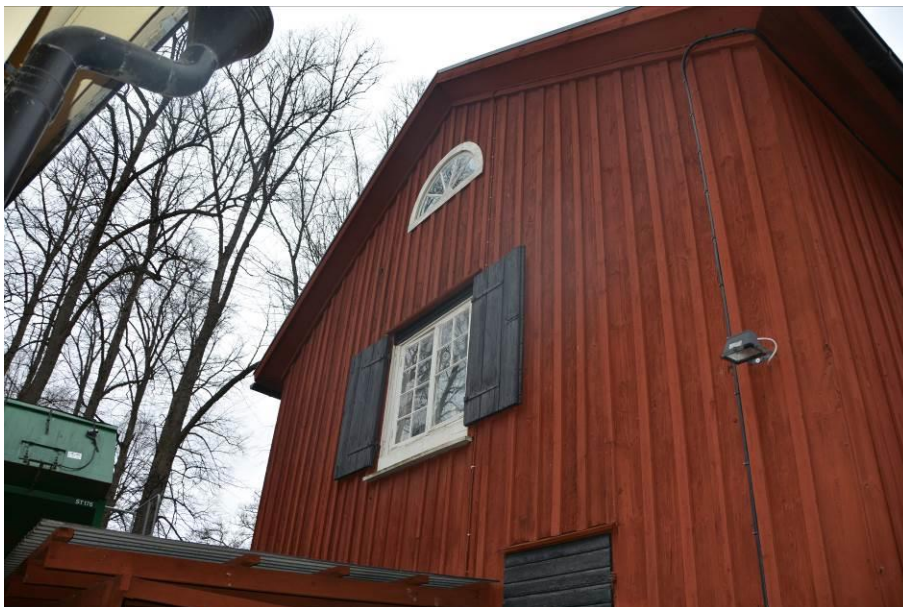
Södra gaveln innan utrymningstrappa byggdes. BildID:Vlm_kmvSB-3560