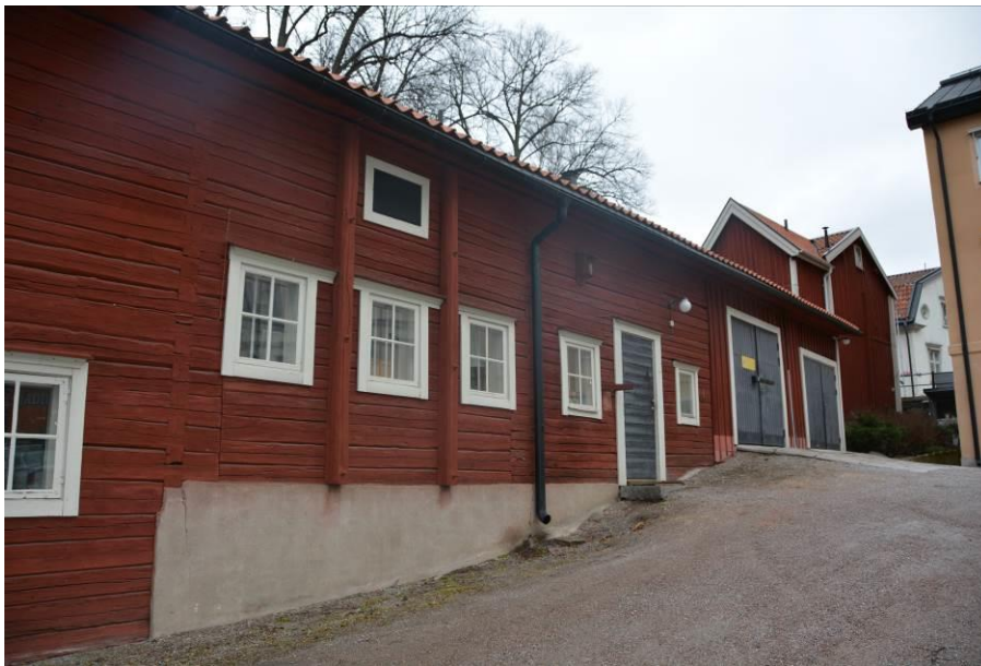
Fasaden mot gården i mars 2015 innan åtgärder. BildID:Vlm_kmvSB-3552