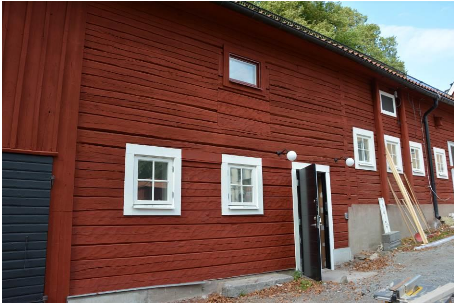
Fasad mot gård. Dörren har flyttat åt höger och timmerstommen är ilagad. BildID:Vlm_kmvSB-5339