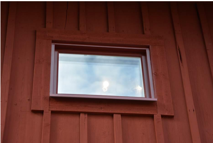
Ett av fyra nya fönster som sattes in och utformades för att verka diskret på fasaden. BildID: Vlm_kmvSB-5337