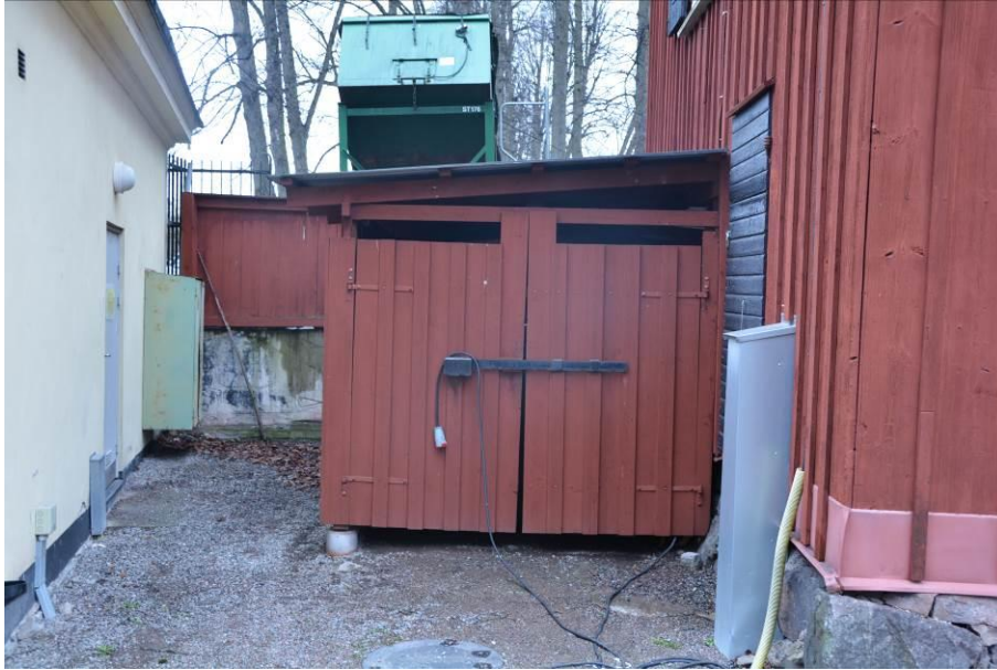
Skjulet på södra gaveln som revs. BildID:Vlm_kmvSB-3558