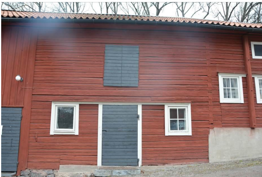
Fasad mot gård i mars 2015. BildID:Vlm_kmvSB-3553