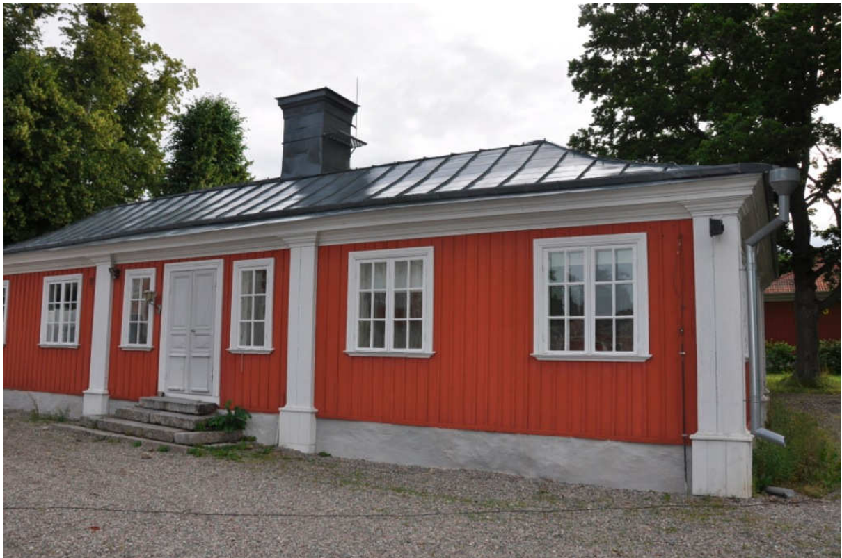
Bild 6, Byggnaden efter grundmålning.