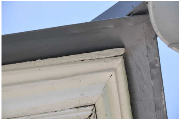
Bild 9 , plåtens utsprång vid takfoten efter slutstrykning. Bild Vlm_kmvFE-1482.