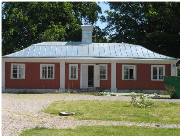
Bild 2 , Fullerö slott efter att det skivtäckta taket lagts om. För att få en målbar yta stod taket omålat i nära 4 år.

År 2007 lades taket om och en liten dokumentationsyta bestående av 6 stycken plåtar sparades och målades med Isotrol takgrund och därefter 2 strykningar med Isotrol taktäck i kulören NCS s-7502 B (se bild 2 och 3). Inför aktuell målning fanns två alternativ till hur målningen skulle genomföras. Alternativ 1 innefattade att grundmålas med Isotrol takgrund samt 2 strykningar Lasol. Alternativ 2 innefattade grundmålning med Isotrol takgrund och sedan Isospeed, slutstrykning skedde med Isotrol Taktäck. Alternativ 1 valdes som metod för aktuell målning.