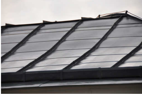
Bild 4 , taket grundmålades med Isotrol takgrund. Bild Vlm_kmvFE-1425.

Taket tvättades först med hetvatten med 270 bars tryck. Därefter grundmålades taket med Isotrol takgrund, som är en linoljealkydfärg. Nästa strykning skedde med Lasol som späddes ut med 10 % (Fabrikat Engwall & Claesson Linoljefärg utvändig). 1 När läns museet kopplades in som antikvarisk medverkande var taket redan grundmålat (se bild 4-6).