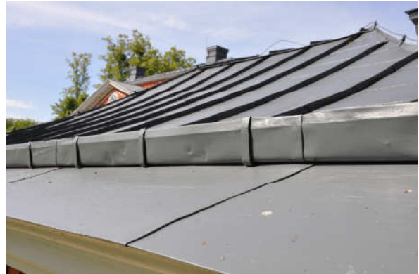
Bild 8 , södra takfallet efter slutstrykning. Bild Vlm_kmvFE-1488