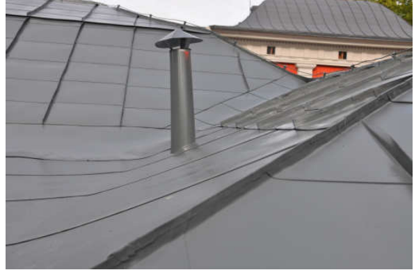
Bild 5, taket grundmålat.