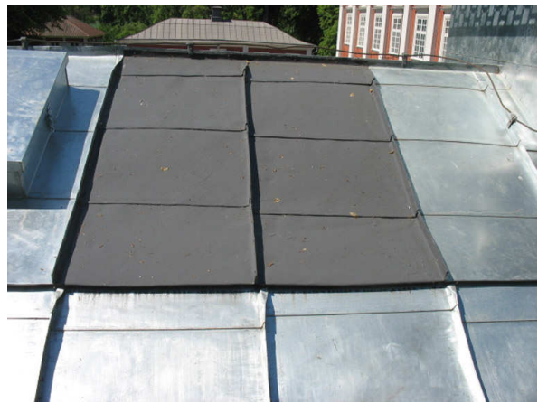
Bild 3 , En dokumentationsyta lämnades och målades med linoljealkydfärg.