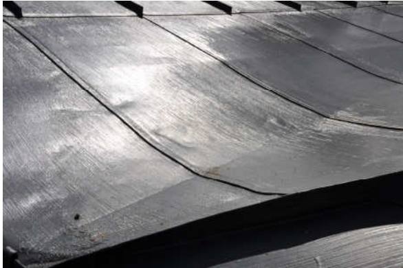
Bild 7 , taket slutströks med Lasol som sprutades på, taket efterdrogs sedan med pensel. Bild Vlm_kmvFE-1484.

Taket slutströks med Lasol (Fabrikat Engwall & Claesson, Lasol Utvändig linoljefärg) i kulören NCS s-7502 B. Färgen sprutades på och efterdrogs sedan med pensel (se bild 7-9).