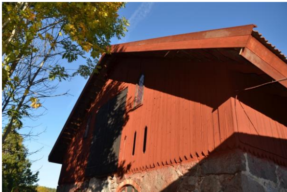
Nya vindskivor spikades på byggnaden. Vlm_kmvFE-3918