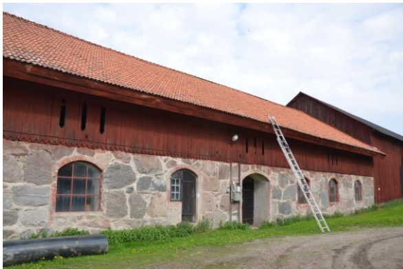
Ladugården innan åtgärderna. Vlm_kmvFE-2995