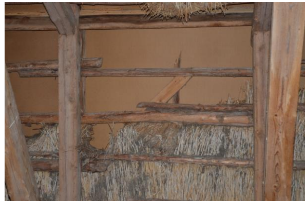
Oljehärdad board lades på halmtaket. Vlm_kmvFE-3929