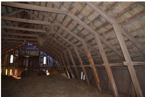
Höskullen efter genomförda åtgärder. Vlm_kmvFE-3931