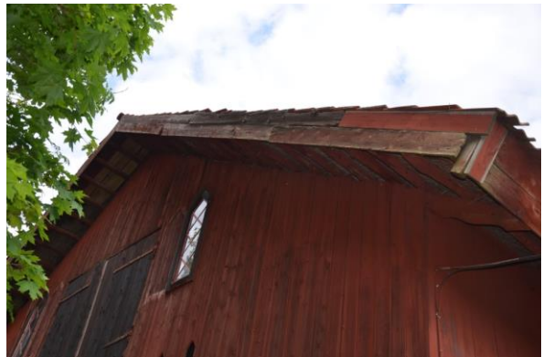
Rötskadad vindskiva. Vlm_kmvFE-2994