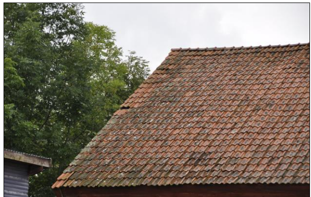
Tegelpannor låg snett och glipade. Vlm_kmvIM-2667