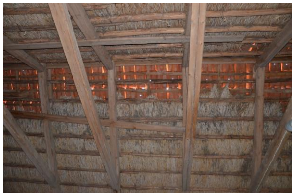
Teglet låg glest och glipade. Vlm_kmvFE-2993