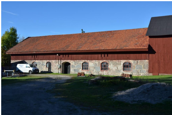
Ladugården efter åtgärderna. Vlm_kmvFE-3933