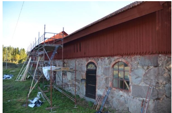
Ladugården under pågående arbetet, ställningen håller på att plockas ned. Vlm_kmvFE-3920