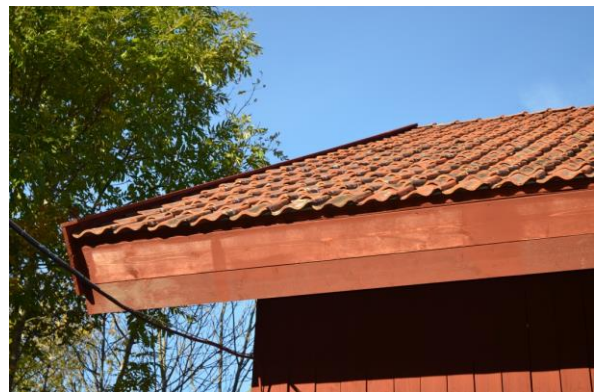
Ny takfotsbräda. Vlm_kmvIM-3917