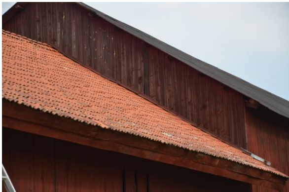
Anslutningen mellan ladugården och logen vad gjord med en plåtlist. Vlm_kmvFE-2996